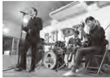
▲スーパーライブ in 北斗七星もこの事業を利用しています