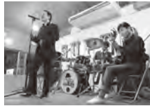
▲スーパーライブ in 北斗七星もこの事業を利用しています