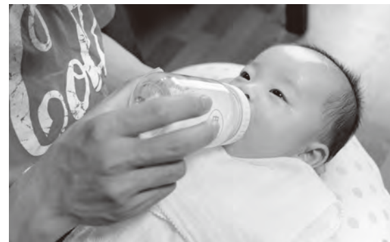
子どもを健やかに育てるためにも上手にストレスを解消しましょう。