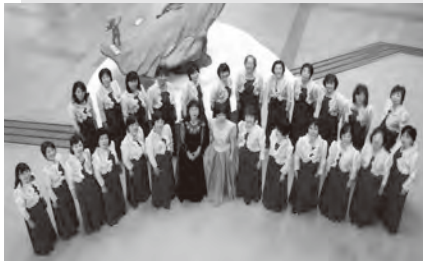
女声合唱団 薔薇のコーラス

平成5年に「童謡を歌う会」から始まり、今年で24年目を迎えます。メンバーは岡垣町と近隣市町に住む30人。童謡やポップス、クラシックなどさまざまな曲で、町民文化祭や北九州市マラソンコンサートなどに出演しました。 今年は4年ぶりのコンサートの年。ぜひ聴きに来てください！