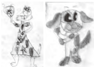
▲6歳のときに描いた猫(左)と10歳のときに描いた犬(右)

私は子どものときから絵を描くことが大好きです。最も古い記憶は、カーペットにペンで落書きしてお父さんに叱られたことです。今でもペンを持つとつい紙に落書きしてしまいます。