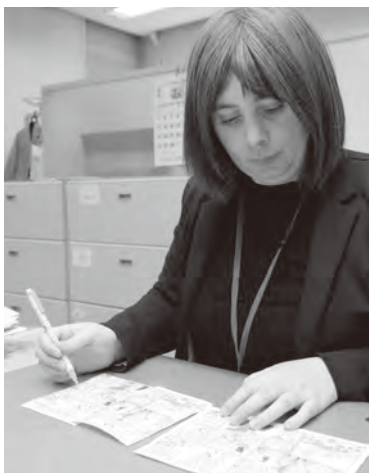
▲今回紹介する「Kitty Chat」の英語と日本語に間違いがないか確認しています

さて、今回のテーマは「自分の趣味」。私の趣味は「絵を描くこと」です。このページのイラストは、いつも私が描いています。