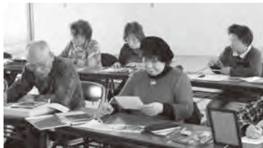
▲若潮学級(色鉛筆コース)

現在、来年度に催す講座に向けて準備中です。詳しくは広報おかがき4月10日号に折り込むチラシまたはパンフレットを見てください。