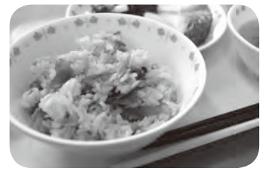
▲町の郷土料理「波津ごはん」

子どもたちに、給食を通じて食の楽しさや大切さを学んでもらえるよう、今後もさまざまな取り組みを行っていきたいです。