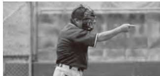
▲判定ミスは許されない。いつも真剣に自信を持って判定をくだす

A 約7年ほど前から、岡垣町寿会連合会と一緒にゲートゴルフというスポーツを考案し、取り組んでいます。今後は、これを町内全域に広めたいと思っています。野球は辞めてしまいましたが、ゲートボールやゲートゴルフなどを地域の人たちと楽しんでいきたいです。