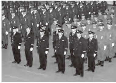
▲式典は厳かに行われました