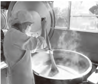
▲味見をしながら最終調整

夏は、子どもたちはたくさん汗をかくので、いつもより塩分を濃い目にします。また、天候や時期によって野菜