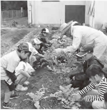
▲戸切小学校の学校農園

子どものころに身につけた食習慣は、大人になってもほとんど変わりません。朝食を食べなかったり、好きなものだけ食べたりしていると、栄養が偏ってしまい、生