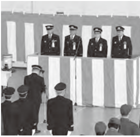
▲郡内4町長への答辞