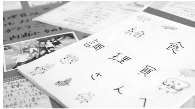
▲子どもたちからのメッセージが給食づくりの活力に

町内の小中学校では、田植えやイモの苗植えなど学年に応じた農業体験を行っています。生産者に教わりながら食材を作る大変さを肌で感じ、食べ物を食べられることへの感謝の気持ちを育みます。さらに小規模校では学校農園を運営し、収穫した野菜を給食に取り入れています。年に一回行う「給食感謝集会」で