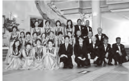
混声合唱団 ドルチェ岡垣