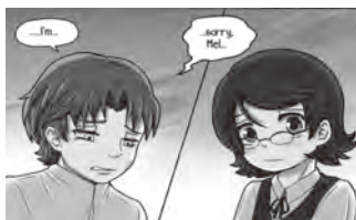
▲暇なときは漫画を描いています

子どものころ「人間はかわいく描けないものだ」と思って描けなかったのが、私の描くキャラクターはすべて猫でした。人間のように話したり、二足で歩いたり、友達と遊んだり、レストランで食事をしたりしていましたが、見た目は猫でした(たまに犬のキャラクターも)。しかし、11歳の