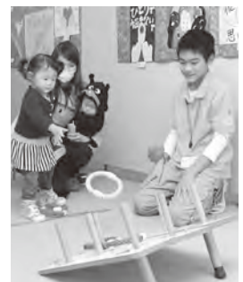
▲こどもイベントでゲームコーナーを運営

岡垣町ボランティアクラブは、町内の小学4年生～社会人を会員とする団体です。ボランティアの考え方や社会に貢献する心を養い、活動を通して世代を超えた絆づくりを目標にしています。