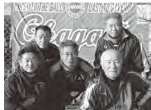
▲長年チームを支えている指導者

サッカーを楽しむことを第一に、日々練習に励んでいる両チームには、30年を超える歴史があります。岡垣サザンイレブンは部員募集中です。興味のある人は、チームのアドレスにメールしてください。