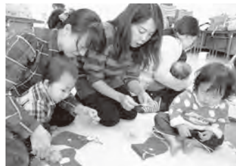
▲親子で楽しめる催しなどを行っている「子育てサークルわらじっこ」

提出した口座に振り込まれる。申し込みは、6月上旬から申込書に記載した口座に振り込まれる。