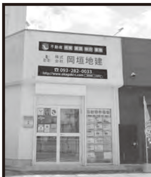
海老津バスのりば横