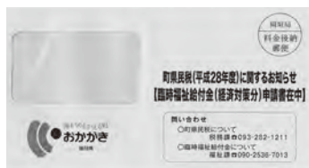
▲対象者に郵送する封筒（紫色）

提出した口座に振り込まれる。申し込みは、6月上旬から申込書に記載した口座に振り込まれる。