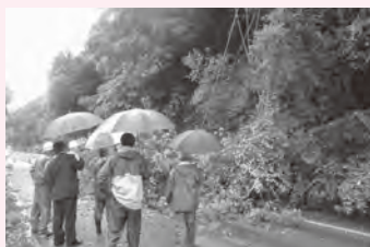
梅雨時期を 迎える前に

A 初期不良や落雷などの 自然災害で壊れたときは、 町が無償で修理や交換をし ます。ただし、故意に破損 させたときなどは、修理代 の請求や新規購入をお願い することがあります。丁寧 に取り扱ってください。