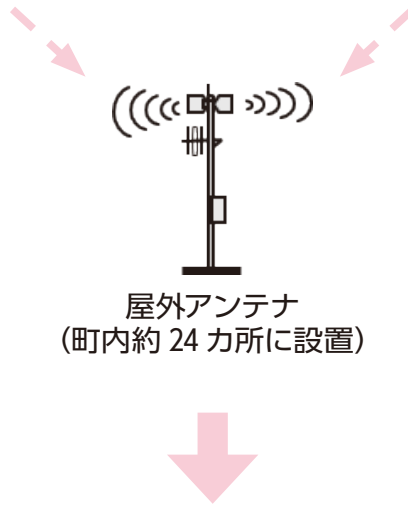
屋外アンテナ (町内約 24 カ所に設置)