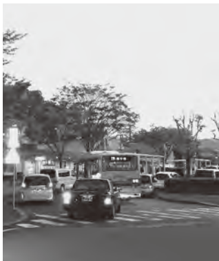
▲送迎時間は車が増えます

さい。また、送迎などで一時的にロータリーに待機するときは、コインパーキングを使ってください。