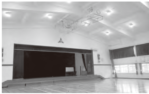
▲岡垣中学校の体育館の照明や天井など

小中学校体育館の照明のLED化を進めています。平成28年度は岡垣中学校体育館の照明のLED化と天井、壁、緞帳などのリニューアルを行いました。