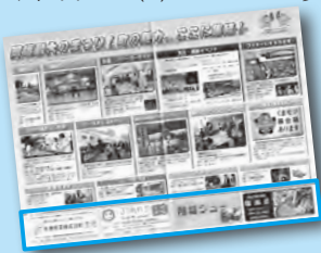
※写真は昨年のチラシ

まったり岡垣のチラシに広告を載せよう 宣伝効果抜群！ チラシは広報おかがき9月25日号に折り込むほか、町内・近隣市町の主要施設や来場者に配ります。 対象 町内の事業所 募集枠数 4※先着順。審査あり 仕様 1枠40×97ミリメートル、カラー、掲載場所は実行委員会が指定 費用 1枠5千円 〔チラシ〕 配布時期 9月25日(月)～10月15日(日) 配布数 約1万8千部 申し込み・問い合わせ 7月24日(月)までにまったり岡垣実行委員会 (産業振興課)へ