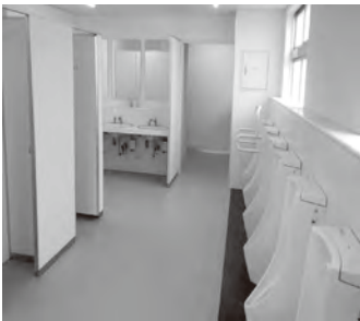
▲写真は平成27年度に改修した岡垣中学校のトイレ