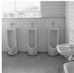
▲現在の内浦小学校のトイレ

町内小中学校のトイレの洋式化を順番に進めています。今年度は、内浦小学校と戸切小学校のトイレを改修します。来年度は、海老津小学校のトイレを改修する予定です。