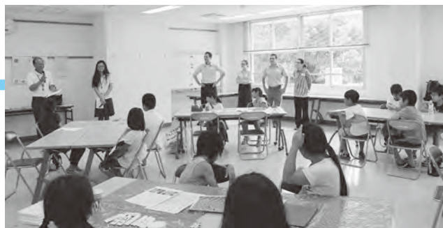
申し込み・問い合わせ 8月14日(月)までに地域づくり課へ

対象 小学3～6年生 とき 8月20日(日)午後1時30分～4時30分 ところ 中央公民館 定員 30人 費用 100円