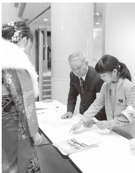
▲式典の受け付けをするボランティアの皆さん