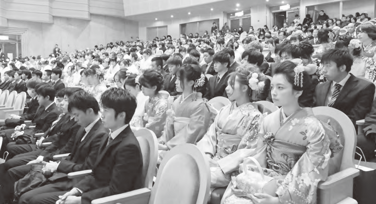
▲さまざまな思いを胸に式典に臨む新成人たち