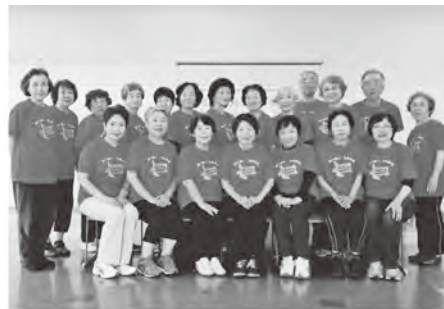
▲おそろいの赤いユニフォームで頑張っています

一緒に活動しませんか 現在会員募集中です。これまでに元気の「わ」広め隊養成講座を修了した人は、ぜひ一緒に活動しましょう。一人でも多くの入会を待っています。 ※平成30年度元気の「わ」広め隊養成講座の受講生募集については、広報おかがき3月10日号を見てください。 問い合わせ 健康づくり課