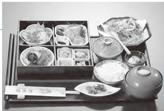
▲昼定食。予約不要で新鮮な料理が楽しめます