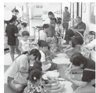
▲昨年行ったなげわ(左)やバルーンアート(右)