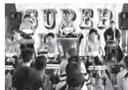
▲スーパーライブ in 北斗七星もこの事業を利用しています