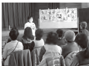
▲「笑いヨガ」で身も心も健康に

防災部会では、地域で活躍する防災士から、災害が起きたときの心掛けや日頃から備えることの大切さ、簡易トイレの使い方などを学びました。