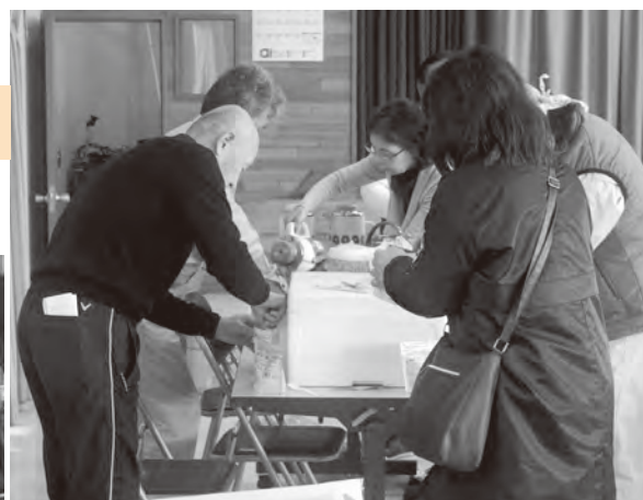
▲いつ起こるか分からない災害に備え、非常食の調理を体験した