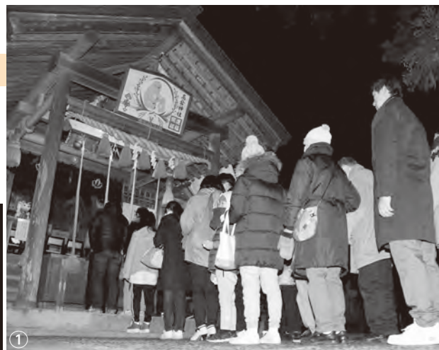
①子どもから大人まで多くの参拝客でにぎわった(高倉神社) ②夜間に除夜の鐘の音が響き渡った(龍昌寺) ③常香炉で身を清める人たち(成田山不動寺) ④幸せな一年を祈り、鈴を鳴らす親子(高倉神社)