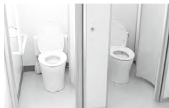
▲海老津小学校の洋式トイレ