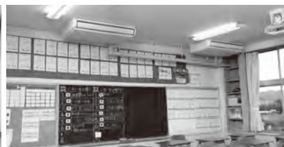
▲すでに設置している岡垣中学校のエアコン