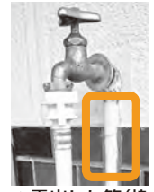
▲露出した管(枠で囲んだ部分)