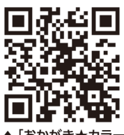
▲「おかがき★カラース」のFacebook

【ともに】 ところ 情報プラザ人の駅 問い合わせ 情報プラザ人の駅 子どもの育ちを考える会に参加しませんか