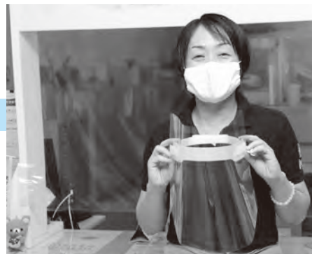
▲健診などの際に着用し、感染症の拡大防止に役立てていきます

なお、いただいたフェイスシールドは感染症対策などのため、大切に活用させていただきます。