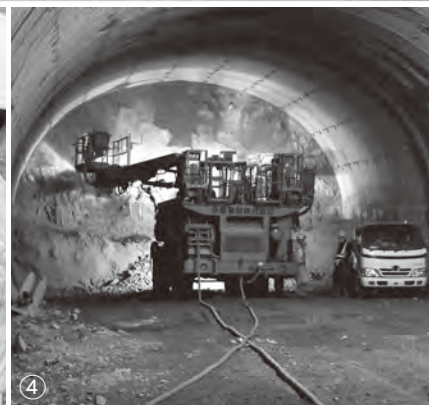
①工事担当者による説明に耳を傾ける参加者たち②トンネルの前で記念に1枚③親子での参加も多く見られた④掘削が進むトンネル内の様子