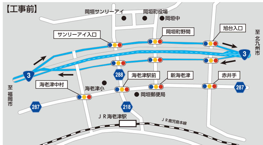
図 野間ランプと山田ランプのフルランプ化イメージ（工事前後）

※ランプ…高低差のある場所をつなぐための道路のこと。今回は国道3号と側道をつなぐ道路を指す。