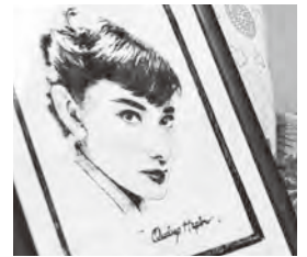
▲今年からは人物画にも挑戦

A 現在、私は吉木小学校の校務員として働いています。モノづくりの知識と技能を生かし、子どもたちがより楽しく学べる環境を整えていきたいです。