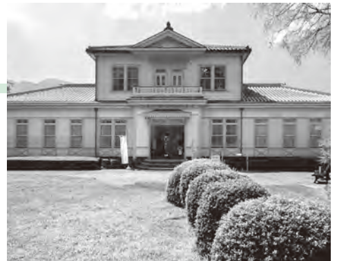
▲国登録文化財 山辺道文化館

募集 町民ふれあい広場では、お知らせ、サークルなどの紹介、イラスト・写真、俳句・短歌・川柳などを募集します。※営利・政治・宗教に関するものなど、掲載できないものもあります。 申し込み 掲載号の前々月15日(1月号は11月16日)までに住所・氏名・電話番号・原稿などを広報情報課に窓口、郵送またはメール(koho2@town.okagaki.lg.jp)で提出※応募多数のときは抽選