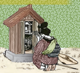
ほら貝を祠に納める女

このほら貝の殻は、現在、北九州市若松区乙丸の貴船神社に祭られており、毎年4月に「ほら貝祭」が行われています。