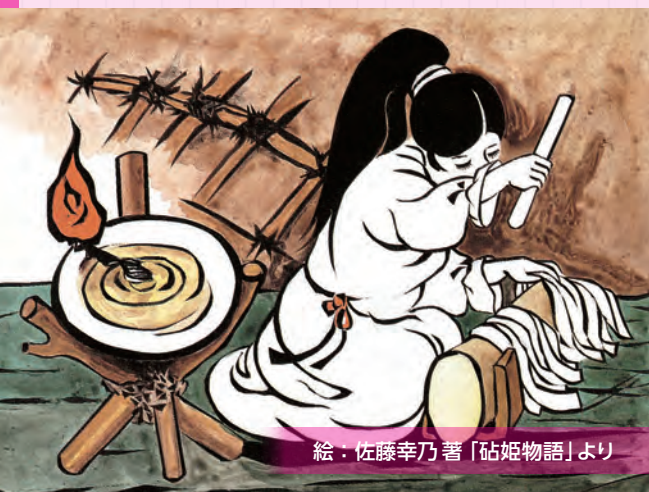
絵：佐藤幸乃著「砧姫物語」より