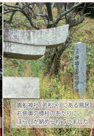
貴船神社（若松区）にある鳥居右側奥の標柱のあたりにほら貝が納められていました