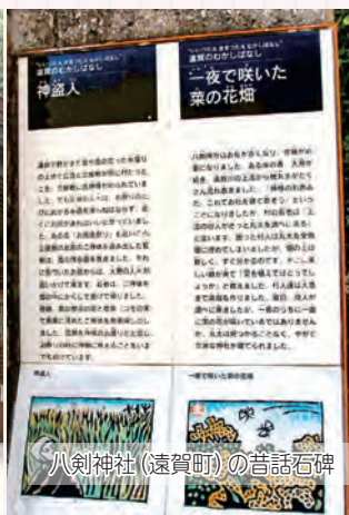
八劍神社（遠賀町）の昔話石碑