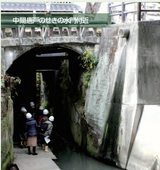
中間唐戸のせきの水門付近