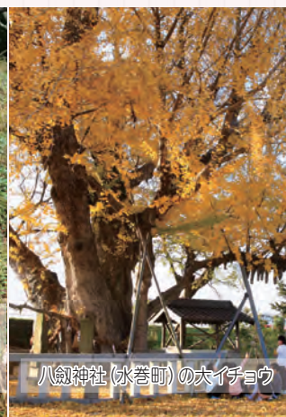
八劍神社（水巻町）の大イチヨウ