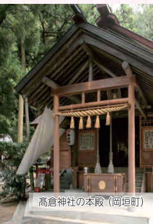
高倉神社の本殿（岡垣町）