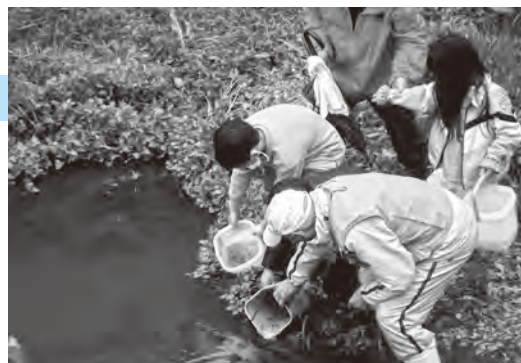
▲サケが大きくなり育ちますように

この付近は町の中心部ですが、川沿いでは季節によってカワセミやホタルが飛び交う姿が楽しめる、憩いの場所となっています。