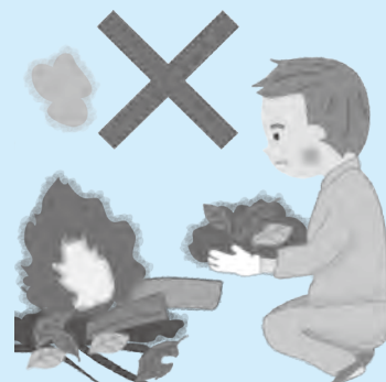
▲煙や臭いが近隣の迷惑になるほか、火事の原因にもなります

ごみや草などを屋外で燃やすことは、一部の例外を除いて法律で禁止されています。違反すると5年以下の懲役または1千万円以下の罰金が科せられます。ごみや草などは野焼きせず、分別してごみとして出してください。