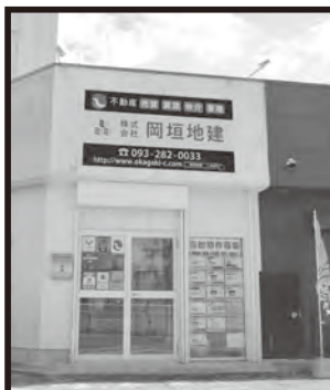
海老津バスのりば横

ところ 中央公民館 対象 町内に住む乳幼児とその保護者または子育てに関心のある人※託児はありません。 申し込み 6月20日(日)までに中央公民館に電話で申し込み 問い合わせ 中央公民館