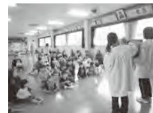
《大型絵本 お話 楽しいね!!》