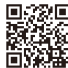
▲芦屋基地ホームページはコチラ