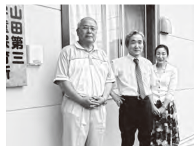
▲理事長(左)と職員。よろしくお願ひします

「NPO法人こども未来おかがぎ」は町内の学童保育所の管理運営を通して、子育てを支援しています。町内各小学校で9カ所設置している学童保育所には、40人以上の児童の登録があります。