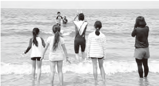
サーフイン教室 (内浦小学校)

町では、家庭の絆を深めたり役割を見直すきっかけとしたりするため、毎月第3日曜日を「家庭の日」と定めています。 また、毎年11月は県教育委員会が「子どもの教育」への関心や理解を県民に深めてもらうために定めている「ふくおか教育月間」。この機会に、家庭でできることを始めてみませんか。 問い合わせ 生涯学習課