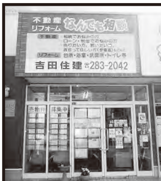
旧3号線沿い茅原信号すぐ側