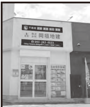
海老津バスのりば横