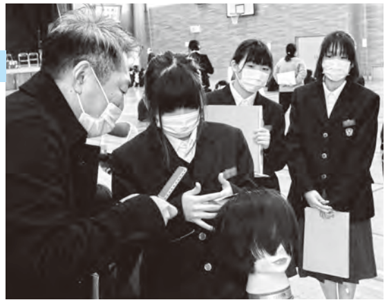
▲美容師が子どもたちにパーマの手順を解説

当日は、保育士や美容師、カラーセラピストなどさまざまな業種で働く人たちが集結。子どもたちからは「職業に対する思い込みが払しょくされた」「実際に働いている人の話を聞けて、とても興味深かった」などの声が聞かれ、将来の夢を考える良いきっかけとなったようです。