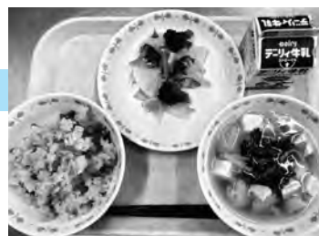
▲当日の献立。左から「波津ご飯」「岡垣サンサンサラダ」「水炊き風汁」

1月23日から26日まで、全国学校給食週間に合わせて給食の歴史や郷土料理を学ぶ給食を子どもたちに提供しました。今年は、1月26日を「岡垣の日」として、岡垣町産のお米や野菜をたくさん使った給食を提供しました。献立の一つ「岡垣サンサンサラダ」の名称は、小学生から募集しました。太陽の恵みを浴びた野菜たっぷりのサラダは、レモンが香る爽やかな味付けで好評でした。