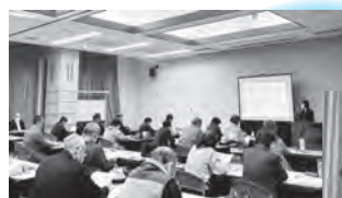
▲相続・終活セミナー