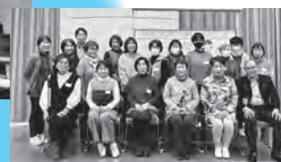
▲女性人材リスト交流会