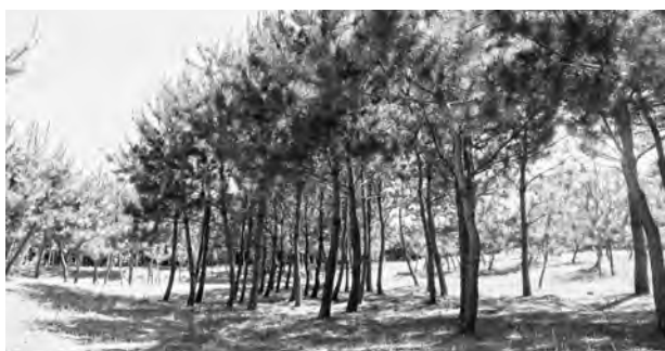
▲整備された三里松原内

我々の身近にある森林を整備することで、住民が森林に触れ合う機会を増やしています。