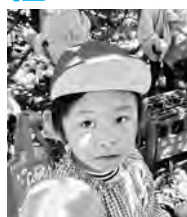
みかん狩りでの1コマ

岡垣第一幼稚園 TEL 093-282-0235 http://www.okagaki-daiichi.com