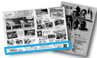
※写真は過去のチラシ。 広告枠は で囲んだ部分

対 象 町内の事業所 募集枠数 4枠※先着順。審査あり 仕 様 1枠40 × 97 mm、カラー ※掲載場所は実行委員会が指定 費 用 1枠5,000 円 配布時期 9月25日(水)～10月20日(日) 配布数 約1万8千部 申し込み・問い合わせ 7月22日(月)までにまつ り岡垣実行委員会 (おかがきPR 課)