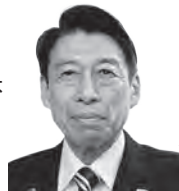
服部誠太郎 県知事

マイナビ ツール・ド・九州 2024の福岡ステージは、岡垣町と宗像市を舞台に、海岸沿いや松林の中を颯爽と駆け抜ける美しいコースとなっています。