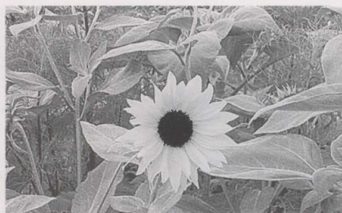
人権の花「ひまわり」