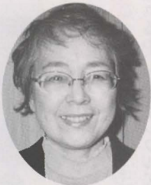
西田 陽子 議員