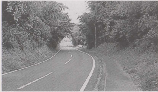
伐採が待たれる大坪・イシキ線(山田)

町長 シルバーに委託する緊急雇用事業は、60歳以上で、失業している人が対象なので、この確保が難しい面もある。