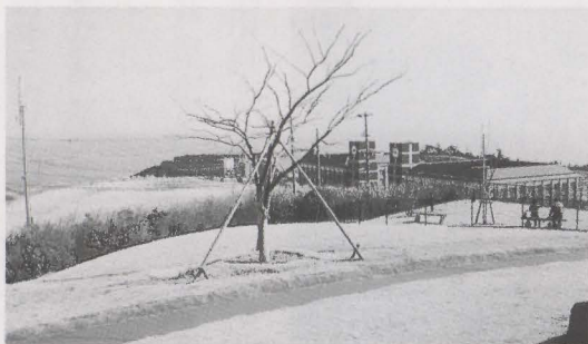
冬の季節に気をつけよう!

町長 まずは、ご本人が医師に申し出ていただきたい。合わせて、医師会とも協議してみたい。