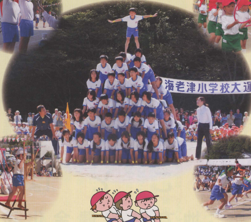
海老津小学校大運