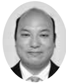
平山 正法 議員