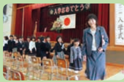
小学校入学式(海老津小)