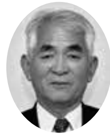
曾宮 良壽 議員

曾宮 高齢ではあるけれど、介護の必要はなく、自立した毎日の暮らしで、重いものを運ぶ、庭木の手入れ、買い物、ゴミ出し等が負担になってきている方々があります。向こう三軒両隣の関係が出来上がっている地域の中では、当たり前のように助け合いの精神が働いています。