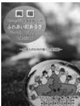
現在、発行されているガイドブック