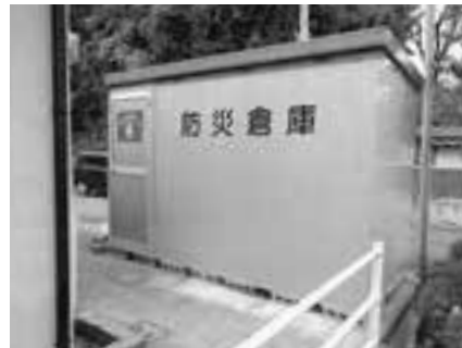
戸切白谷公園に設置されている防災倉庫