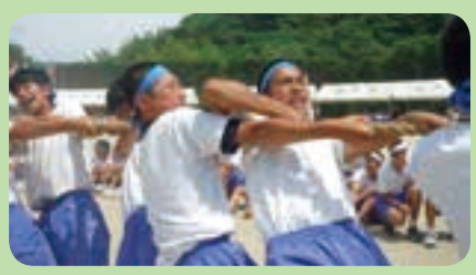
中学校体育会(岡垣東中)