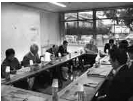
岡垣東部保育所 施設視察