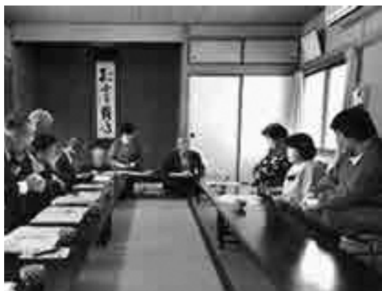
上畑の杜との意見交換

いずれの加工所も生産された野菜や果物を有効に加工することで廃棄する農産物の有効活用につなげたいとのことでした。