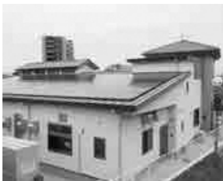
建てかえ後の東部保育所

民生委員・児童委員の任務である「社会奉仕の精神をもって、社会福祉の増進に努める」の責任の重さと活動の実態を改めて認識することができました。