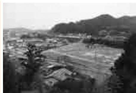
海老津地区の宅地開発

三浦 海老津駅周辺の矢矧川は、カワセミやホタルが見られる格好のスポットとなっています。矢矧川の管理道路は新団地手前に未整備のところがあります。もっと親しみを持ちたいよう整備をお願いします。