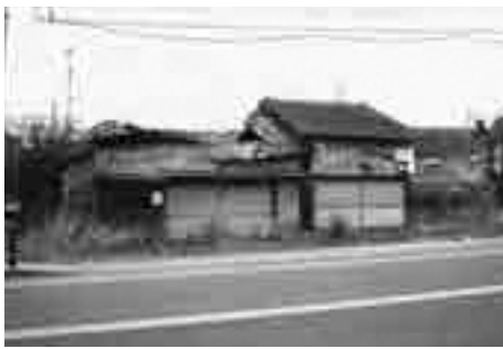
行政代執行された危険家屋

ます。また、ゴミや雑草などの問題についても、関係各課が連携し、総合的に対応してまいります。