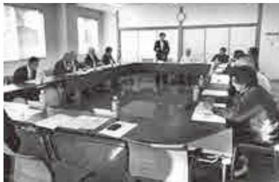
漁協との意見交換

また一方では、磯焼けによる藻場の減少、漁業の拠点である波津漁港は堆砂により、漁港の円滑な利用ができない状態など、緊急な漁業環境対策が必要とされています。本委員会は課題解消へ向けた活動に生かしていきます。