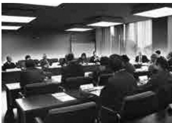
民生委員・児童委員との意見交換