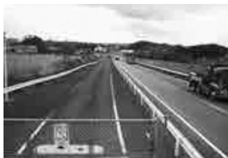
4車線化が待たれる岡垣バイパス

町長 詳細設計及び用地測量が概ね完了し、本年度は道路区域に係る法手続きが行われ、用地買収に必要な調査等が行われています。この県道の完成は、町内幹線道路の充実と国道3号岡垣バイパスと