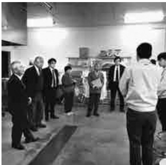
JA北九生産センター 施設視察