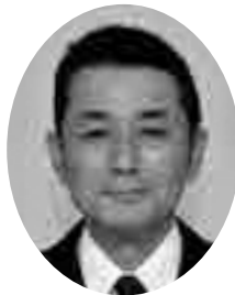
森山 浩二 議員