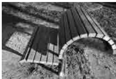
桜公園の背伸ばしチェア

町長 公園ごとに地域の状況と住民ニーズにあった公園施設の適正化を図りながら、地域住民との協議により桜公園に健康遊具を設置しました。今後の健康遊具の設置について