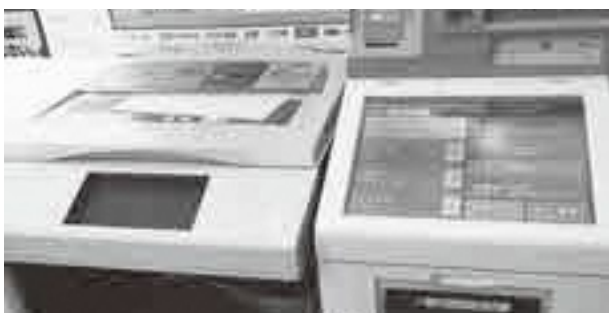
コンビニでの発行機

また、住民サービスの向上及び窓口業務の効率化によるコスト低減が見込めるメリットと、高度なセキュリティによる個人情報の保護や偽造防止がなされるという説明により、賛成とする。