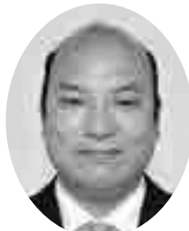
平山 正法 議員