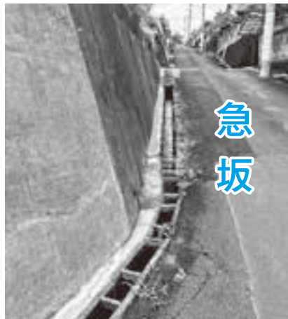
一日も早い改修が待たれる蓋のない側溝

町長 現在策定中の立地適正化計画においても、駅に近い好条件を活かして、町外への通勤通学を要する子育て世代の定住促進の受け皿として、居住人口を誘導していく地域として位置づけられます。今後も側溝整備など団地内の生活環境の改善に努めるとともに、定住促進や空き家対策は既存事業の効果を検証し、団地の再生につながる取組を進めていきます。