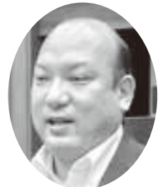
平山 正法 議員