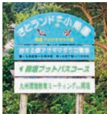
会で設置したさとランド看板

私たちは2000キロ以上も海を越えて旅をする世界唯一の渡り蝶アサギマダラ。幼虫のときに毒性の植物（キジョラン）を食べて体を毒化し、鳥などの捕食から逃れているんだよ。春から夏にかけては北に移動し、秋には南に移動するので、岡垣町に立ち寄っているんだよ。