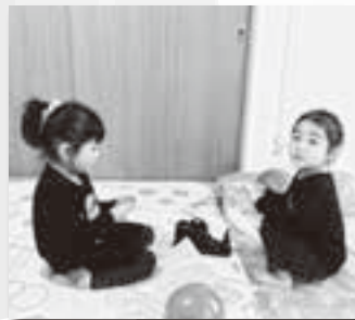
一緒に遊ぶと楽しいね (写真はイメージ)

岡垣町の待機児童数は年々増加傾向にあり、特に1歳児が顕著です。そのため、来年4月に小規模保育事業所を2か所開設します。