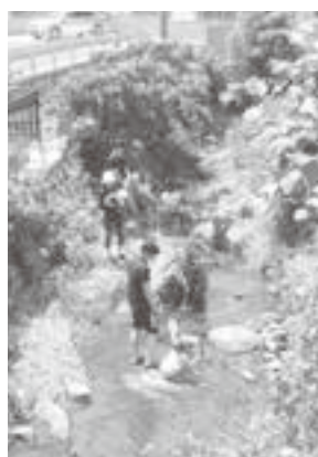
矢矧川で自然体感

これからも、このような活動に取り組む団体の支援を継続しながら、郷土愛の醸成に取り組んでいきたいと考えています。