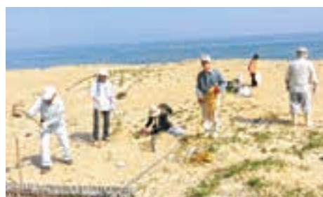
吉木浜で環境整備