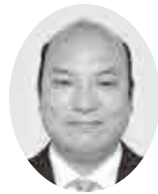
平山 正法 議員

平山 内閣府は、災害が起これば一人で避難できない高齢者、障害者など特に配慮を必要とする避難行動要支援者名簿の作成を市町村に義務づけました。岡垣町における避難行動要支援者の状況と、その対策についてお尋ねします。