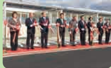
海老津駅南側道路等整備事業完成式典