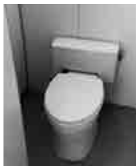
昨年改修された岡垣中学校トイレ