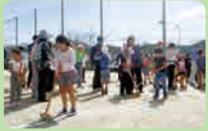
ふれあいスポーツデー