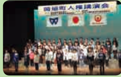
海老津小児童による人権アピール発表