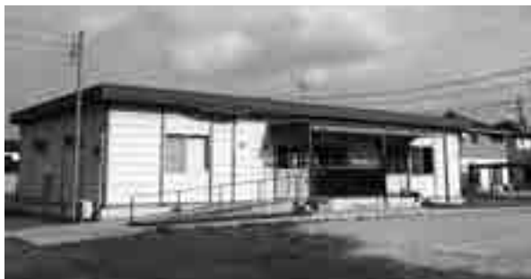
山田第2学童保育所

山田学童保育所の利用者がふえるため、4月から第2学童保育所敷地内に定員60名で開設されます。