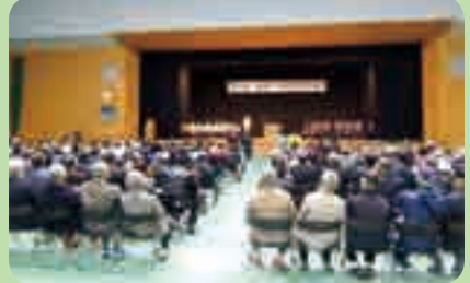
農業祭(サンリーアイ)