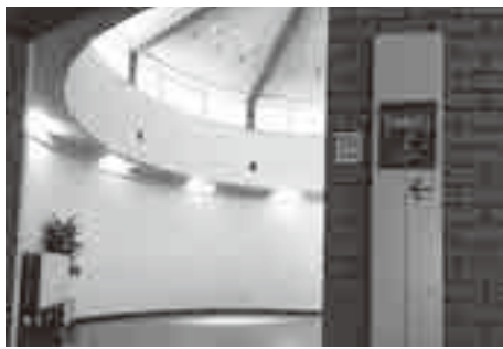
福祉避難所（いこいの里）

町長 毎年計画的に災害用備品等を整備していますが、その中でプライバシー保護のためのパーテーションや簡易更衣室、授乳室を購入するなど、