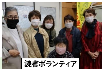
読書ボランティア