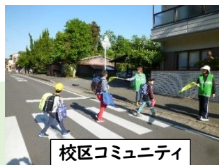
校区コミュニティ